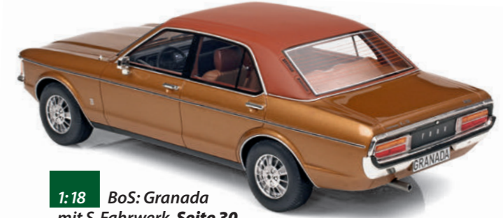
1:18 BoS: Granada mit S-Fahrwerk Seite 30