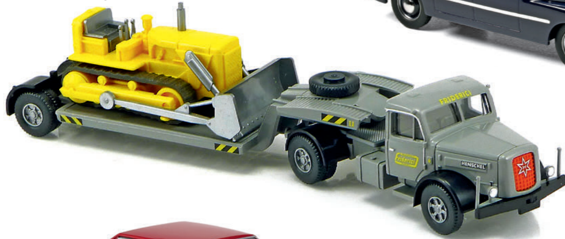
1:87 Wiking: Henschel-Tieflader trägt Trilex Seite 61