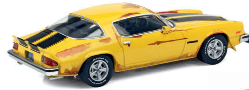
1:43 Neo: Pony Car nicht nur im Rost-Look Seite 72