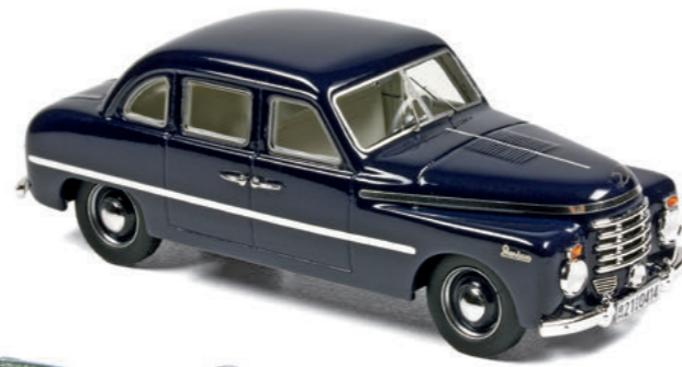
1:43 Autocult: Was, bitte, ist ein Wendax? Das da! Seite 88