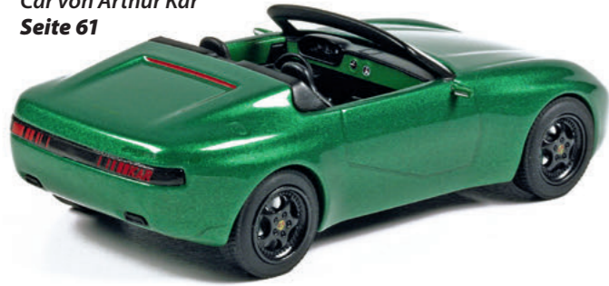
1:43 Minichamps: Ein Art Car von Arthur Kar Seite 61