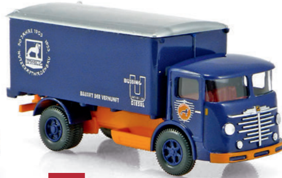
1:87 Wiking: Zum Jubiläum „50 Jahre Büssing“ Seite 47