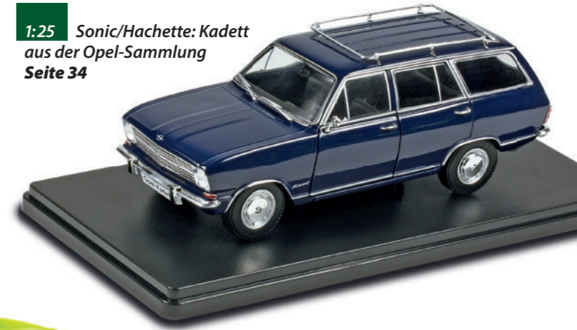
1:25 Sonic/Hachette: Kadett aus der Opel-Sammlung Seite 34