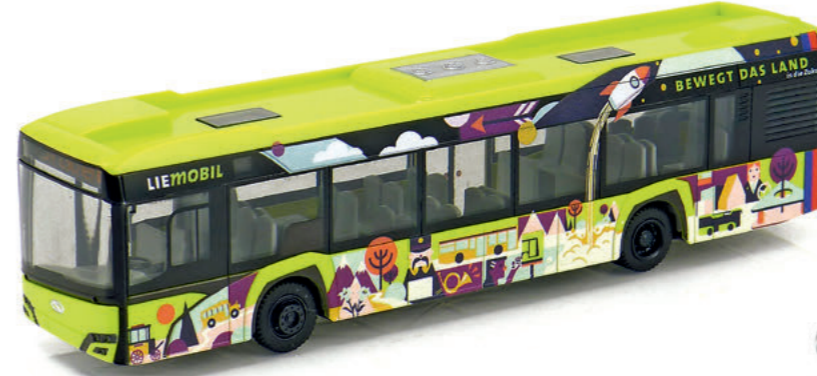
1:87 Rietze: Jubiläum bei Bus und Bahn Seite 58