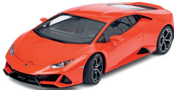
1:18 AUTOart: Ein knalliger Evolutionsschritt Seite 8