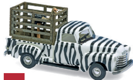
1:87 Busch macht viel mit Lasercut Seite 70