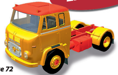
1:87 Wettbewerb mit Scania Frontlenker Seite 72