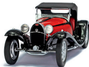
1:18 Vollblut: Der Bugatti von Pantheon Seite 37