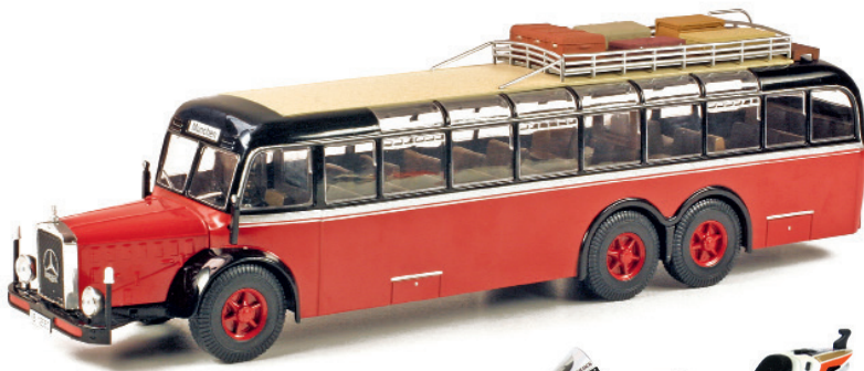
1:43 Günstige Kiosk-Serie: Busse aus aller Welt Seite 82