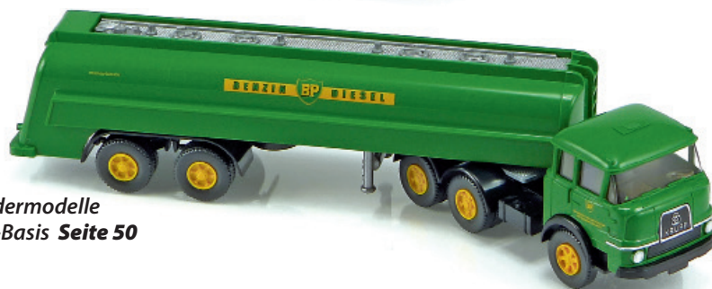
1:87 Sondermodelle auf Wiking-Basis Seite 50