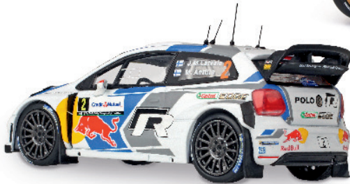
1:43 White Box kann auch Rallye – von Ixo Seite 87