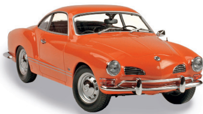
1:18 Schöne Sportcoupés, zum Beispiel auf den Seiten 6, 26, 28