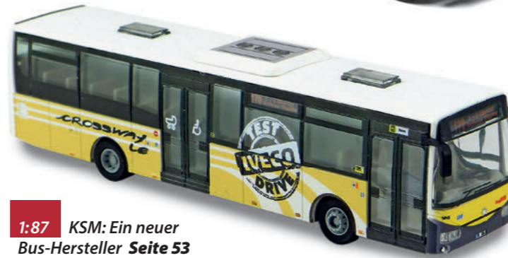
1:87 KSM: Ein neuer Bus-Hersteller Seite 53