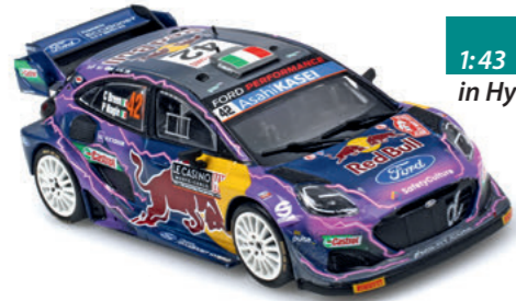
1:43 Ixo: Boliden in Hybrid-Box Seite 70