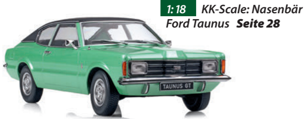
1:18 KK-Scale: Nasenbär Ford Taunus Seite 28