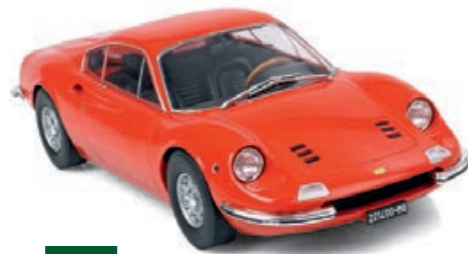
1:18 MCG: Sechs Zylinder sind kein Ferrari Seite 105