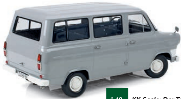
1:18 KK-Scale: Der Transit mit kurzem Radstand Seite 34