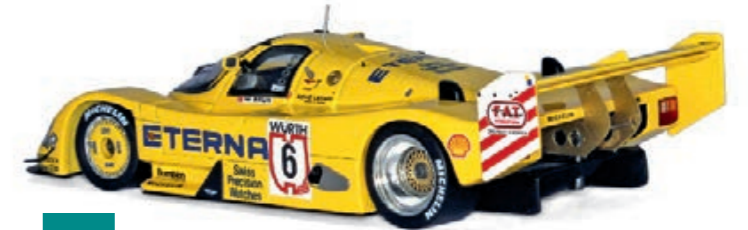
1:43 Car.tima/Spark: Porsches Motorsport-Legende Seite 75