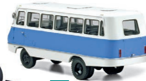
1:43 Start Scale Models: Russische Busse Seite 84