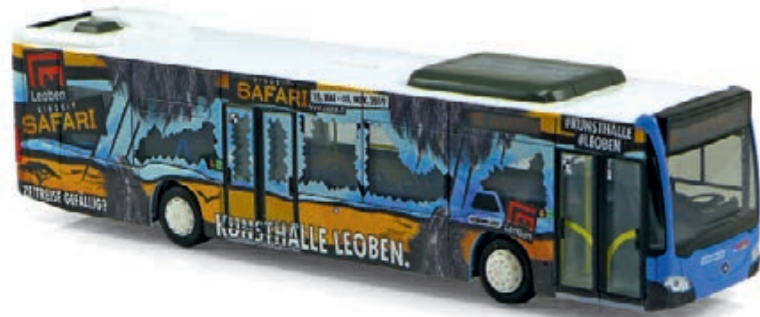
1:87 Rietze: So bunt kann der ÖPNV sein Seite 54