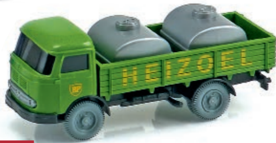
1:87 Wiking: Sondermodelle nicht nur vom PMS Seite 56