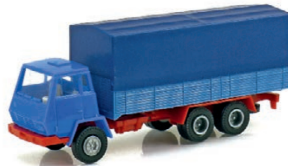
1:87 Steyr-Spezial: Kleinbahn-Lkw als Bausatz Seite 64