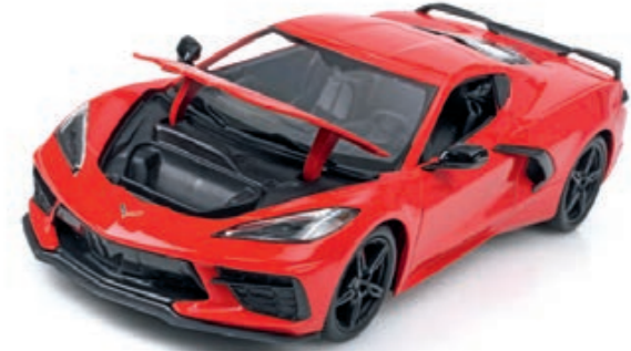
1:18 Maisto: Heiße US-Sportwagen Seite 42